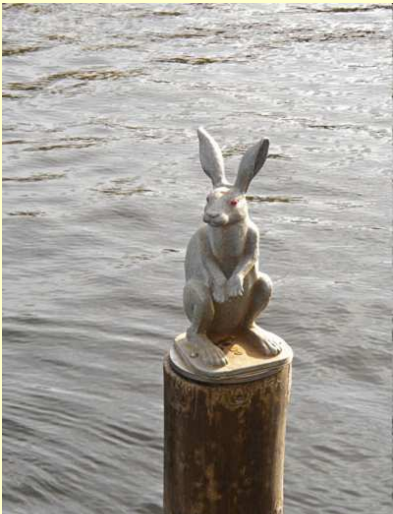
Памятник "Зайчик, спасшийся от наводнения".

Рассказывают, что плотники, строившие крепость, работали медленно, и разгневанный Петр приплыл на остров, чтобы наказать их. Когда он выходил из лодки, ему на сапог вдруг прыгнул зайчик и так развеселил царя, что он не стал наказывать плотников, а остров назвал Заячьим.